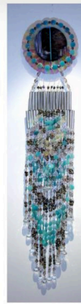
Blue Sunflower Earring, 2008 Plastic and glass beads, aluminum tubing, wire, and plastic 72" (h) x 16" (w) x 6" (d)