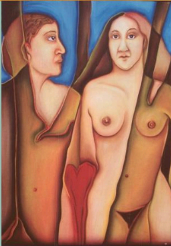
Torso II, 1993 Gouache on paper 26" (h) x 20½" (w)

El actual material de Linda Vallejo, titulado "Make 'em All Mexican", es un grito de resistencia. Una amalgama de las distintas formas plásticas, producto de las exploraciones antropológicas e introspecciones culturales que ocupan mucho de su tiempo. Una fusión de artes clásicas como el barroco y el rococó, con iconografía cultural moderna. Habiendo producido varias colecciones pictóricas y esculturales, Vallejo se da el lujo de darle un descanso al lienzo, al acrílico o a la acuarela, para incursionar de lleno en la uti-