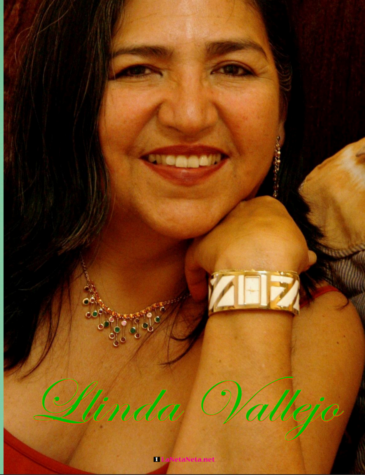
Twin Spirits, 1990 Tree fragment, handmade paper, Procion dyes 42" (h) x 21" (w) x 9" (d)