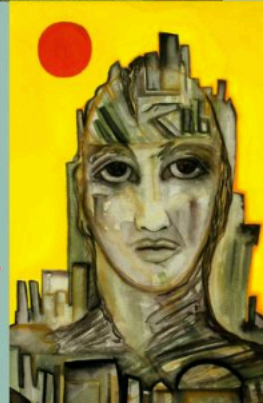
Death of Urban Humanity II, 1993 22" x 15" Gouache on Arches