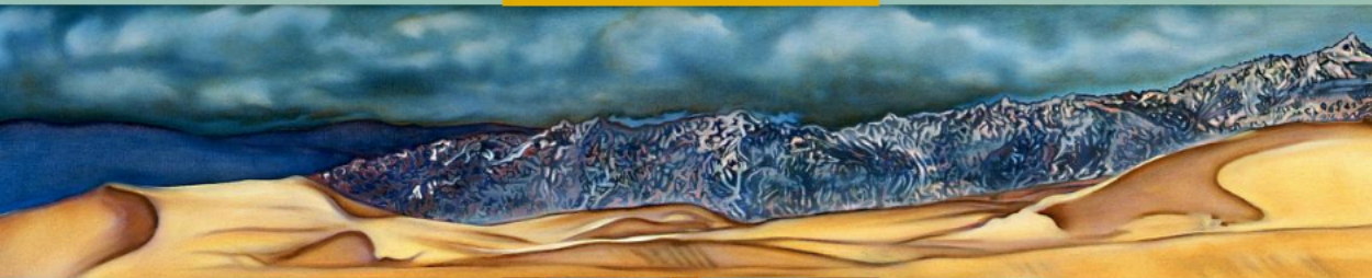
Salt Flats, 2006 16" x 72" Oil on canvas

El actual material de Linda Vallejo, titulado "Make 'em All Mexican", es un grito de resistencia. Una amalgama de las distintas formas plásticas, producto de las exploraciones antropológicas e introspecciones culturales que ocupan mucho de su tiempo. Una fusión de artes clásicas como el barroco y el rococó, con iconografía cultural moderna. Habiendo producido varias colecciones pictóricas y esculturales, Vallejo se da el lujo de darle un descanso al lienzo, al acrílico o a la acuarela, para incursionar de lleno en la uti-