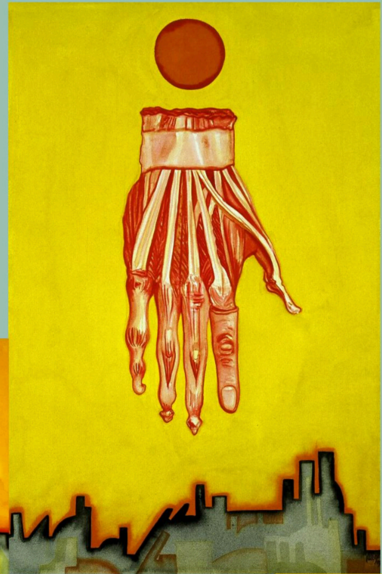
Death of Urban Humanity III, 1993 22" x 15" Gouache on Arches

"Make 'em All Mexican" es una colección de objetos, figuras, imágenes y fetiches que al ser manipuladas por Vallejo, cambian de carácter y se vuelven transculturales, reflejando la transculturización de la sociedad norteamericana del nuevo milenio. Vallejo nos muestra—por medio de sus objetos—una sociedad que se enfrenta al dilema de ser cada vez mas diversa; de hecho, más diversa que nunca antes en su historia. Sin embargo, a pesar de ello, esta misma sociedad se aferra a viejos demonios, a sus turbulencias raciales, pasadas y presentes, producto de su no tan lejano origen colonial.