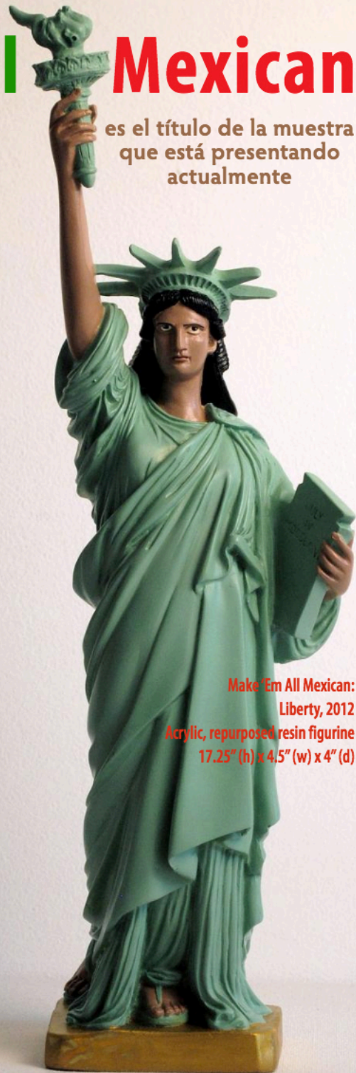
Make ‘Em All Mexican: Liberty, 2012 Acrylic, repurposed resin figurine 17.25" (h) x 4.5" (w) x 4" (d)

es el título de la muestra que está presentando actualmente