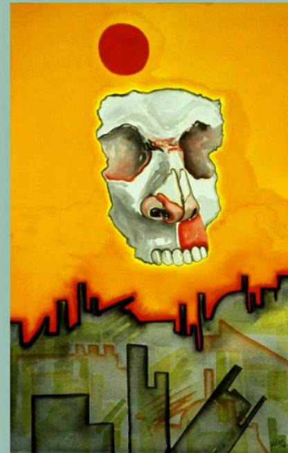
Death of Urban Humanity I, 1993 22" x 15" Gouache on Arches

Al principio te ríes de lo paródico y chistoso que te propone. Pero poco a poco su propuesta visual comienza a romper estereotipos y a desarmar símbolos. Empiezas a ver lo banal desde una óptica que, siendo satírica, está más cerca de nuestra realidad "formal" de lo que imaginamos.