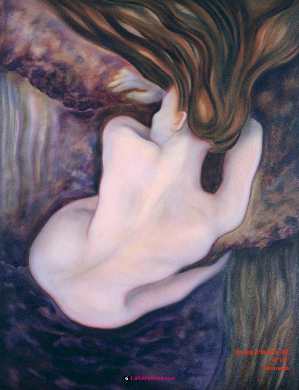
Dreaming of the Earth, 2003 48" x 36" Oil on canvas