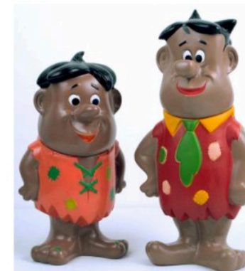
Fred and Barney, 2012 Acrylic, repurposed rubber figurines F: 11.5" (h) x 5" (w) x 4.5" (d) B: 9.75" (h) x 5" (w) x 5" (d)