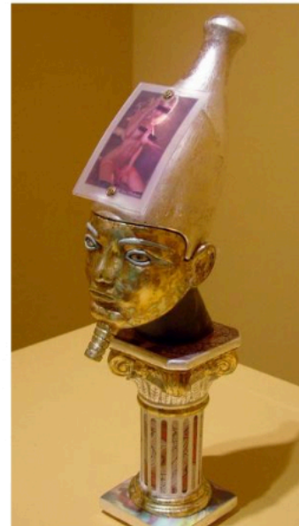
I Wonder What The King's Got On His Mind Tonight?, 2008 Pre-produced resin and ceramic, digital prints of original paintings, oil, silver and gold leaf 7" (h) x 20" (w) x 4" (d)