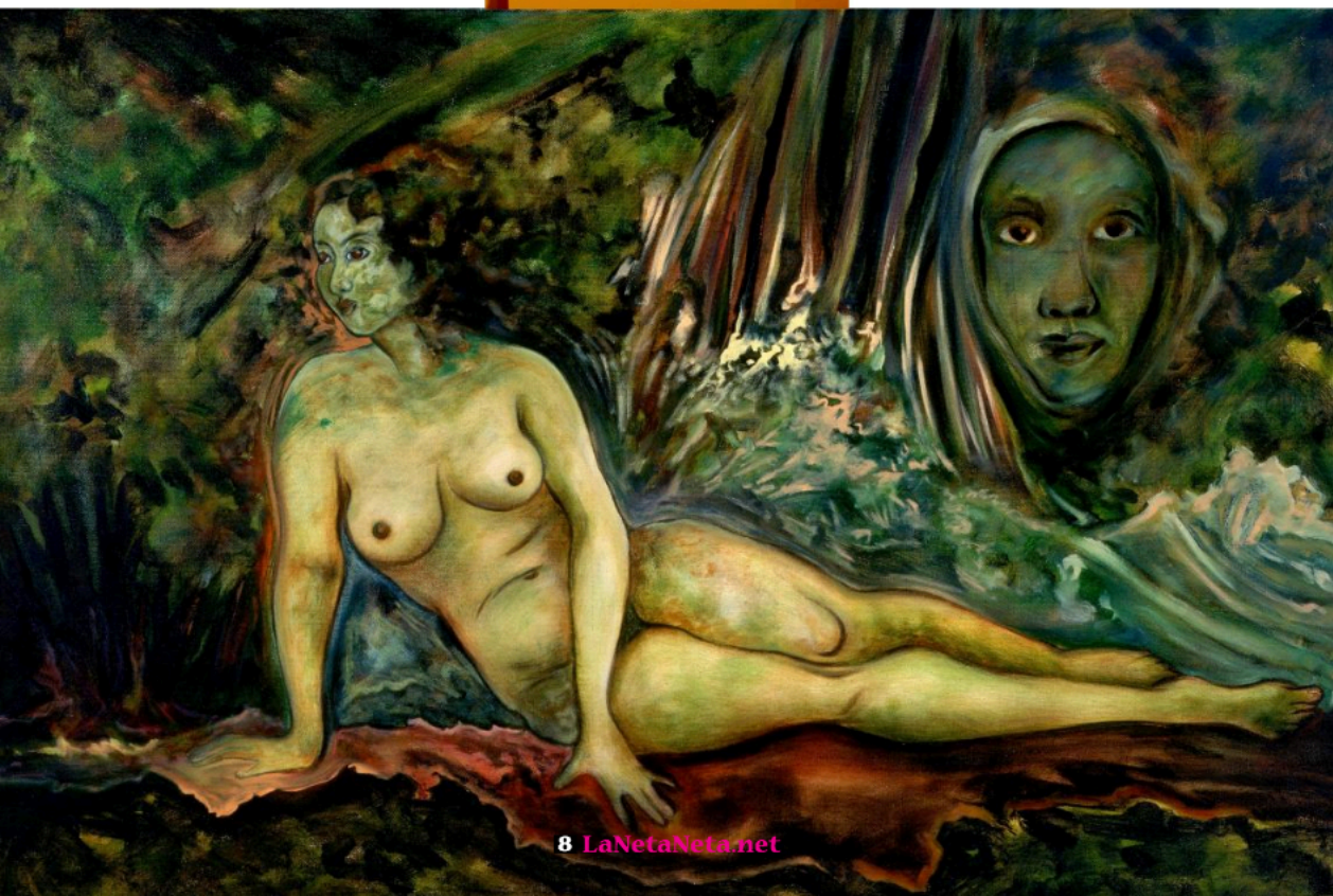
Seedling II, 2005 Oil on canvas 30" (h) x 20" (w)

por esculturas como "Twin Spirits" (Espíritus Gemelos) o "Mujer Tonantzin".