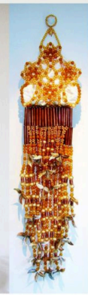
Golden Earring, 2008 Plastic beads, mother of pearl, satin, copper tubing, wire, and rubber tubing 60" (h) x 16" (w) x 3" (d)